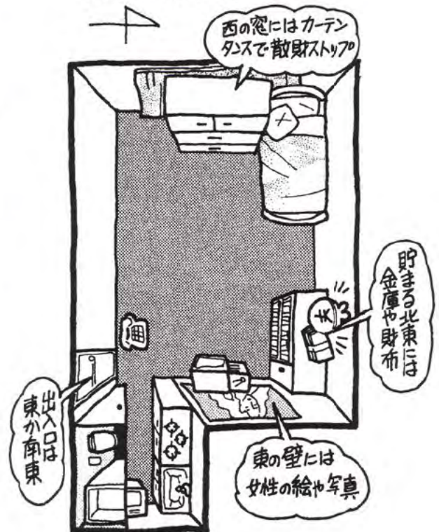
図 14 お金の貯まる部屋

若く美しい女性には金運を高める力があります。こういう絵やポスターは、西や南東といった東以外に飾っても十分効果があります。